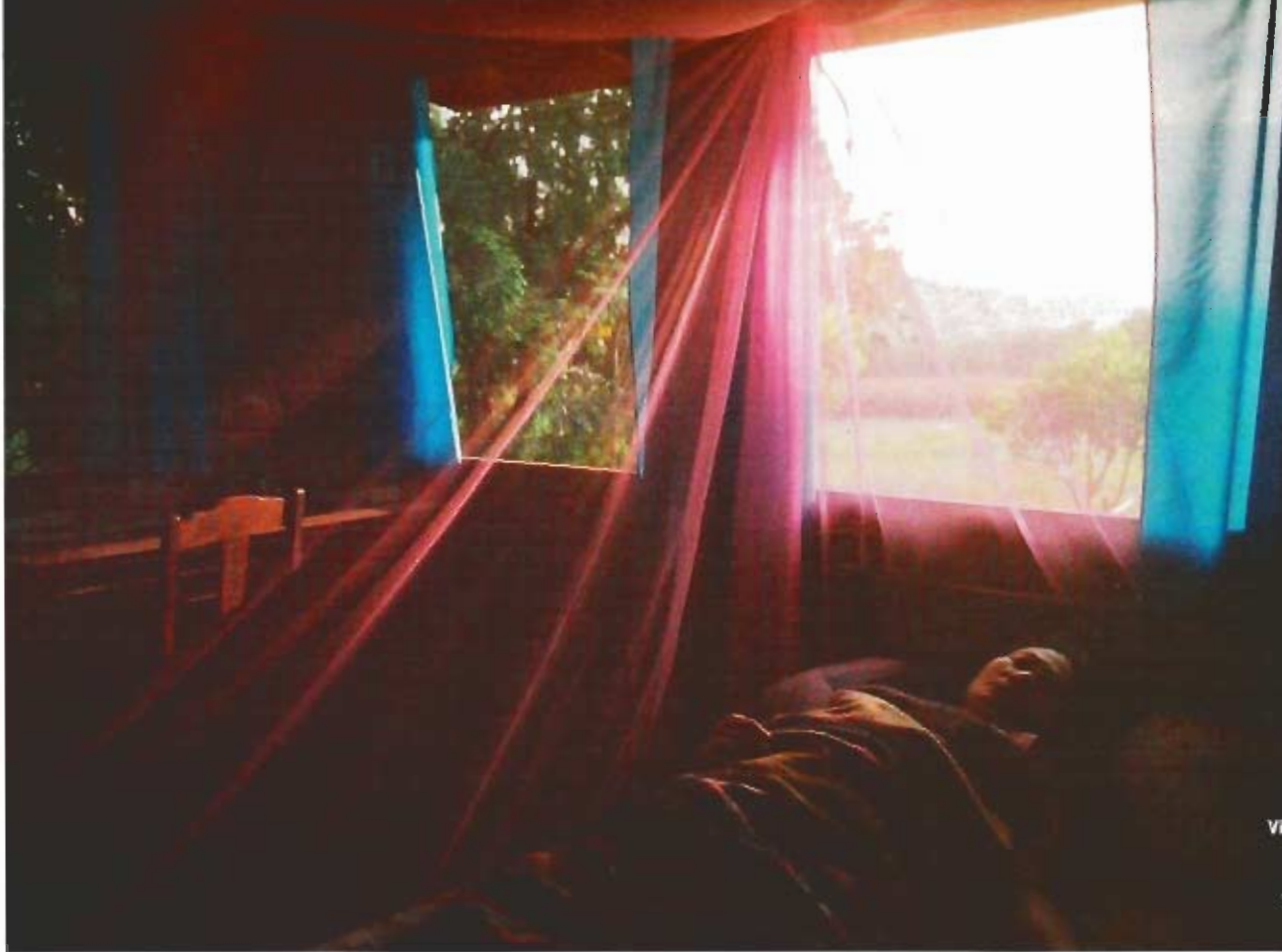
Vitres, voiles, reflets les mondes en vol d'évaporation d'Apichatpong Weerasethakul dans Oncle Boonmee

d'un discours très construit, rompu à la théorie et au commentaire. "Par ailleurs, le fantôme est un bon motif pour le cinéma. Il pose la question de l'illusion, qui est au centre du processus cinématographique, et celle de la croyance. Le fantôme est le corps cinématographique par excellence. Et puis, il aborde la question de la mémoire, qui me passionne par-dessus tout. "