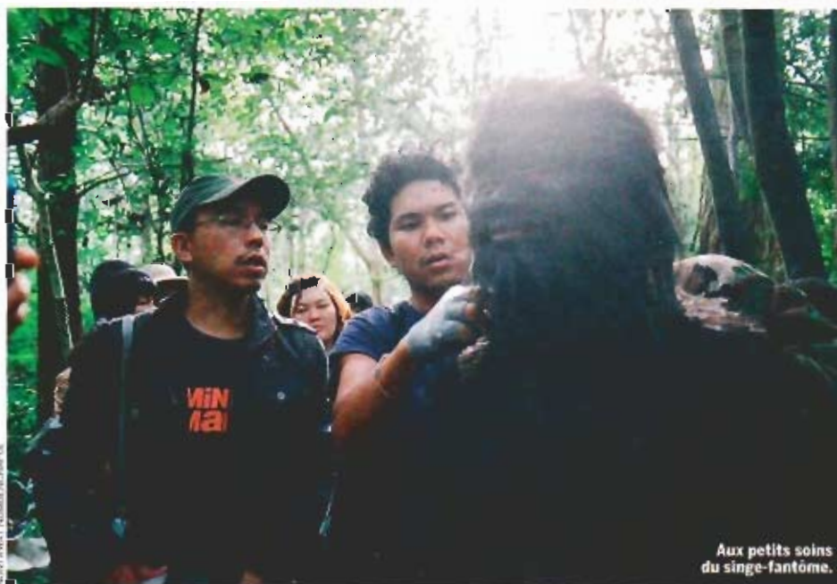
Aux petits soins du singe-fantôme.

Lentement, les fantômes disparaissent. Même si en Thaïlande nous en avons encore beaucoup plus que dans d'autres pays."